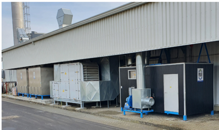
Bild 1. MIAB FD-anläggning med två filter, se rostfria enheter till vänster, samt katalysator, se svart enhet med dörr till höger.