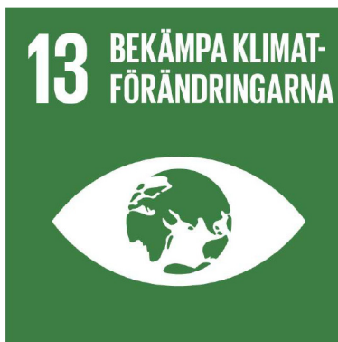
Bild 3. Bekämpa klimatförändringarna Globalt miljömål nr 13.