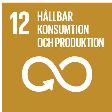
Bild 2. Hållbar konsumtion och produktion Globalt miljömål nr 12.