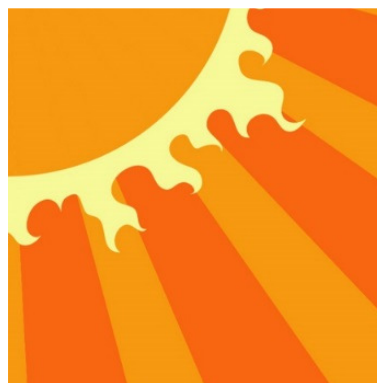
Bild 6. Begränsad klimatpåverkan Svenskt miljömål